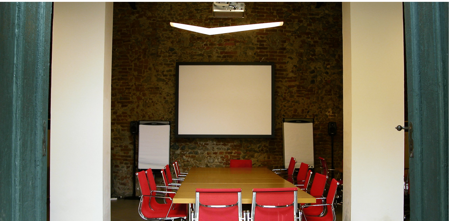
Sala Farinelli — board room con videoproiettore a specchio convesso