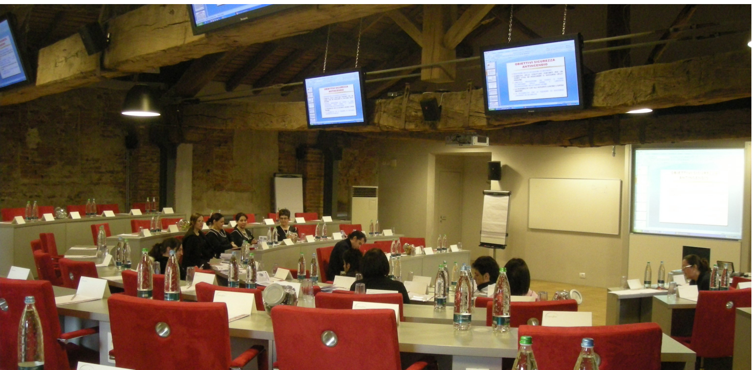
Sala Pavarotti – configurazione anfiteatro, 80 posti