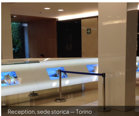
Reception, sede storica — Torino

Quest'ultimo dettaglio ha l'impatto strategico più interessante: rende il signage un'opzione attivabile anche in spazi che oggi non lo sono. Una sala riunioni può, in prospettiva, ospitare contenuti signage quando non è in uso, e tornare immediatamente al sistema di videocollaborazione quando qualcuno tocca il pannello.