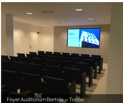
Foyer Auditorium Bertola — Torino